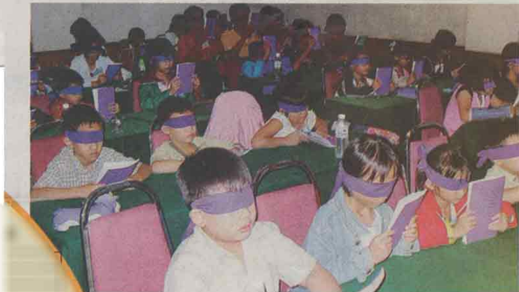
蒙眼也能读书？事实确实教人惊讶！