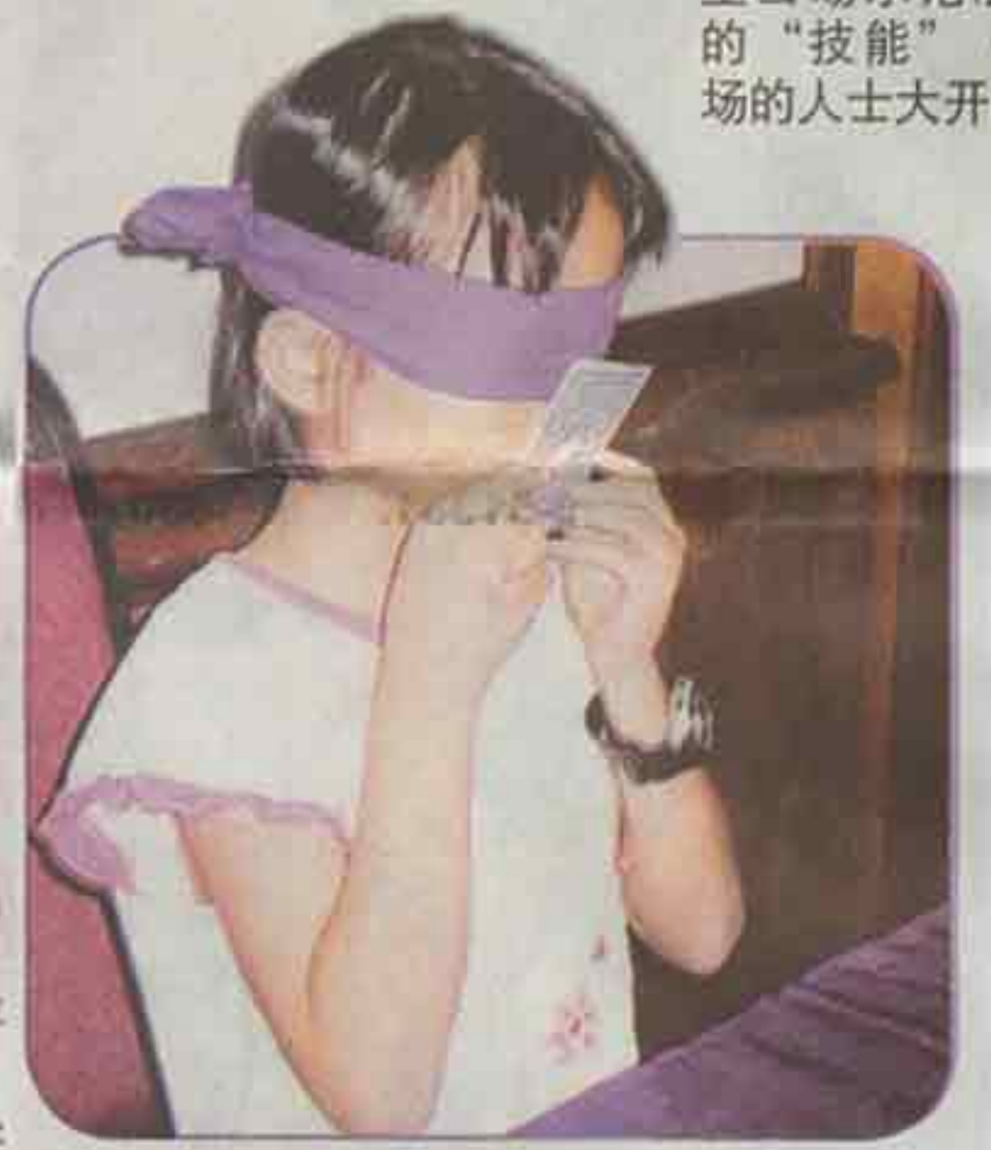
学生把卡片贴近自己，通过脑电波感应手中的数目字。

为了让学员更加投入，此课程的学习方式是以游戏为主，让孩子能通过游戏开发右脑的潜在能力。