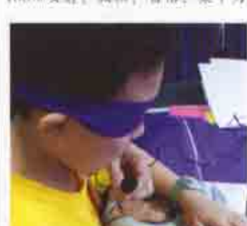
100% 安静！放松！自信！集中力！